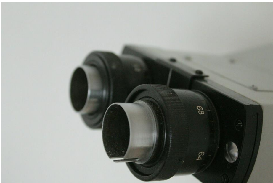
Die Okularaufnahme des Binotubus. Der Schlitz dient zur genauen Positionierung der Okulare (Spezialokulare, spannungsfrei mit Stift zur Ausrichtung)