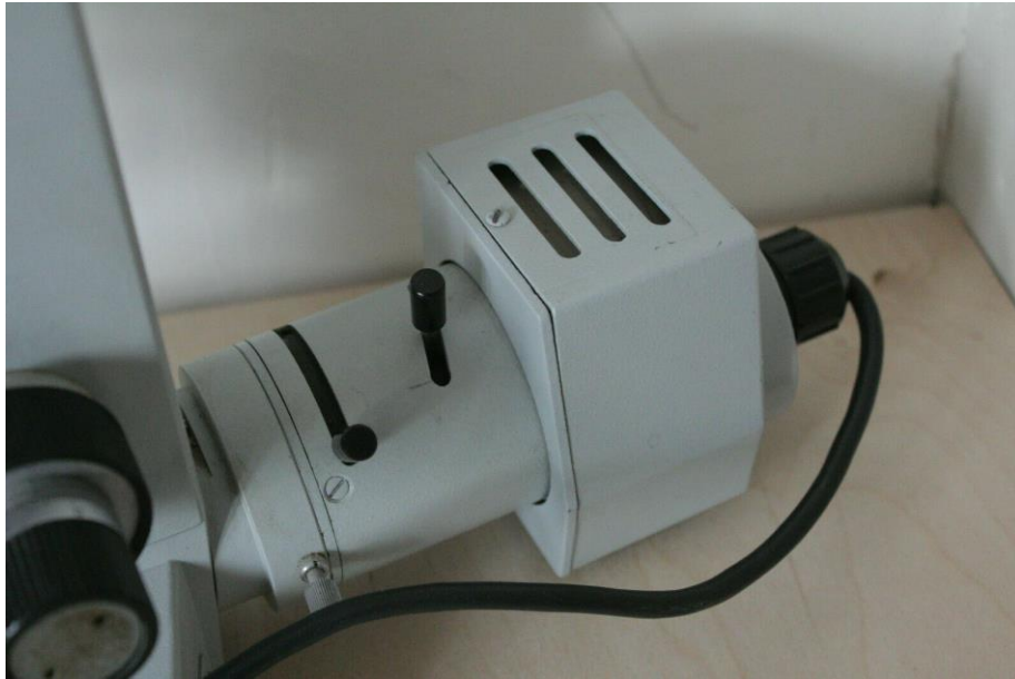
Die Beleuchtungseinheit. Ausführung mit Leuchtmittel 8V 15W Baj15d. Linker Hebel für Leuchtfeldblende, rechter Hebel für Fokus.