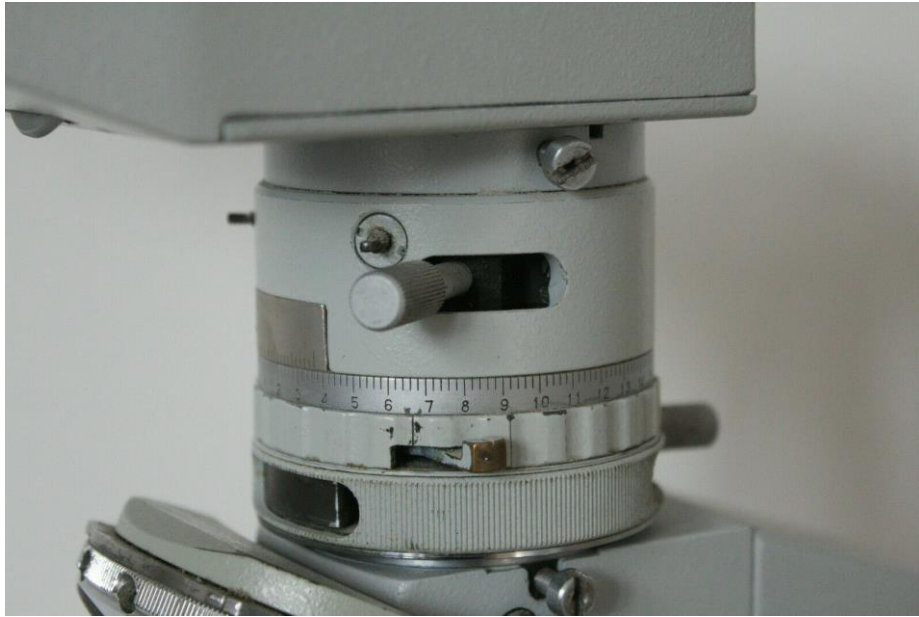
Zwischenstück mit Analysator, zentrierbarer Blende und Öffnungen für Einschübe.