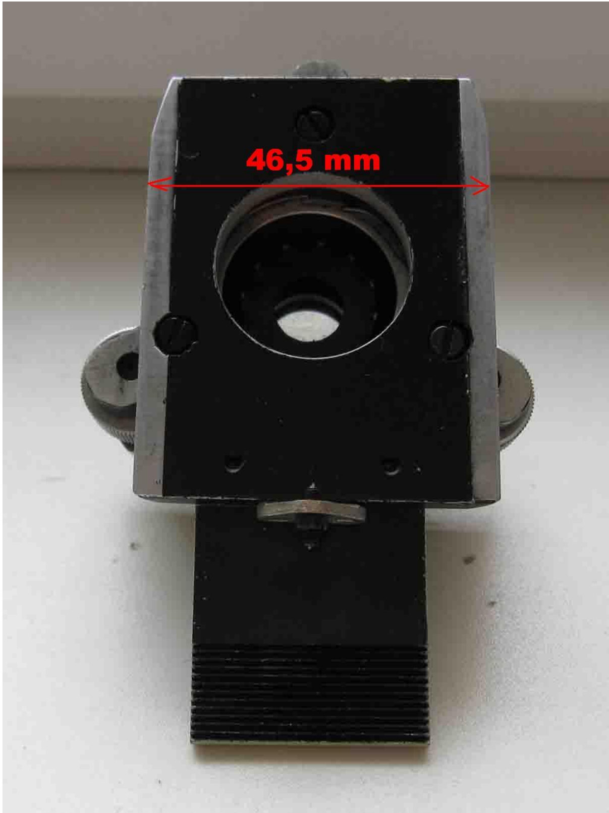
Maße des Schlittens