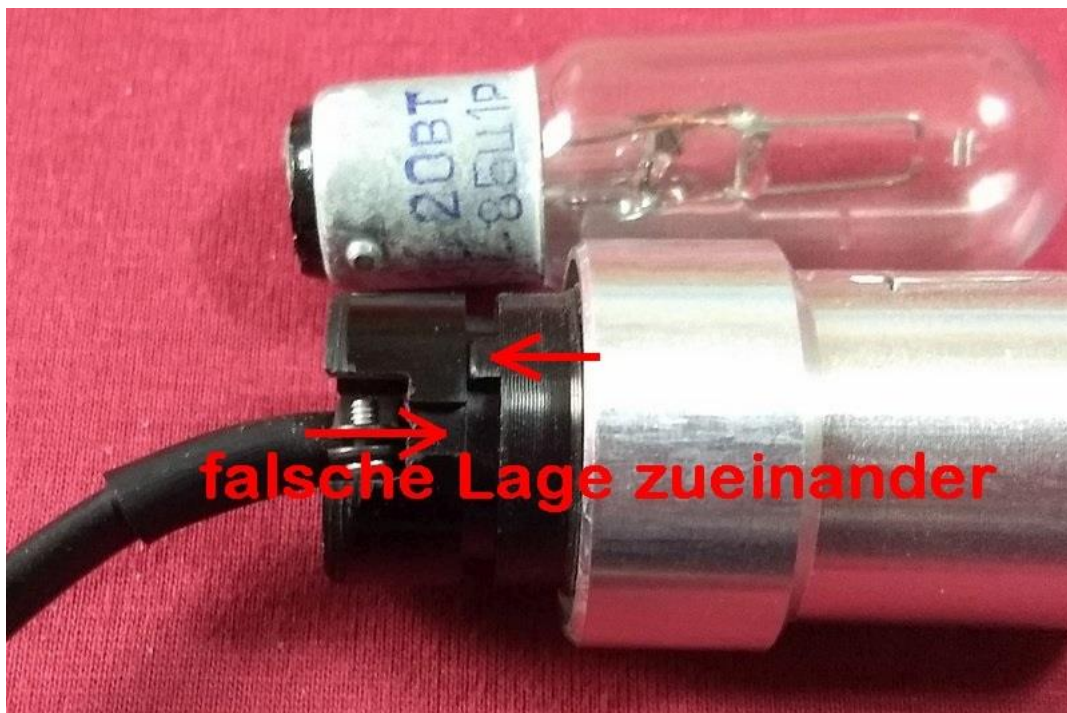
Lampenfassung mit Leuchtmittel