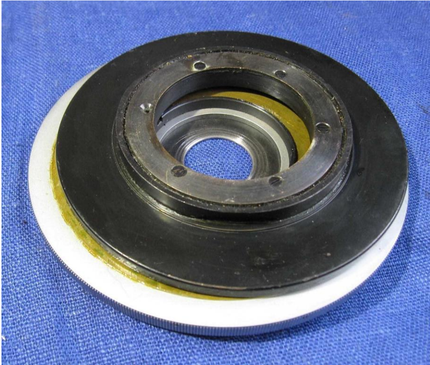
Ansicht von unten mit Befestigungskragen