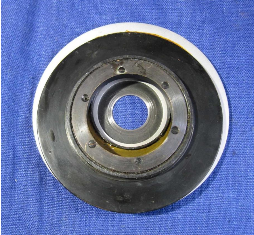
Ansicht von unten